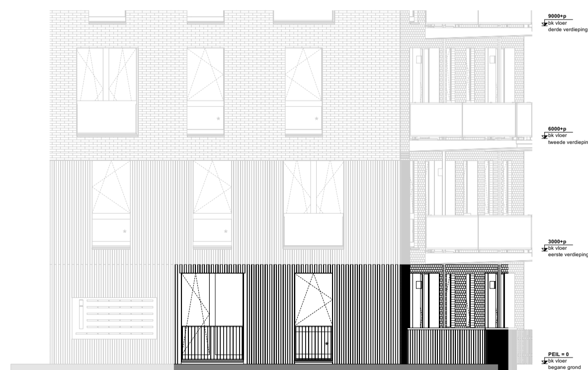
Noordgevel begane grond 1:100