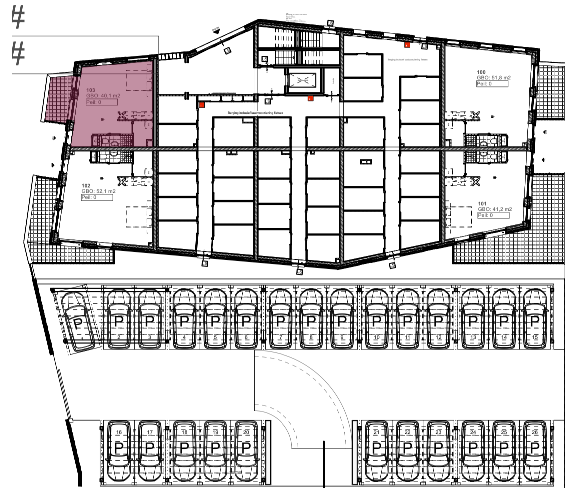
Overzicht begane grond Bouwnummer: 103 Woningtype: A.4