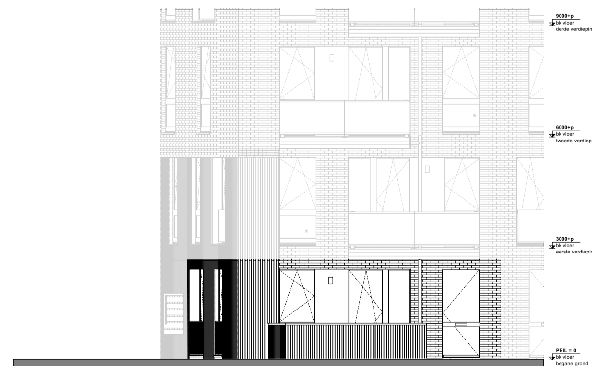
Westgevel begane grond 1:100