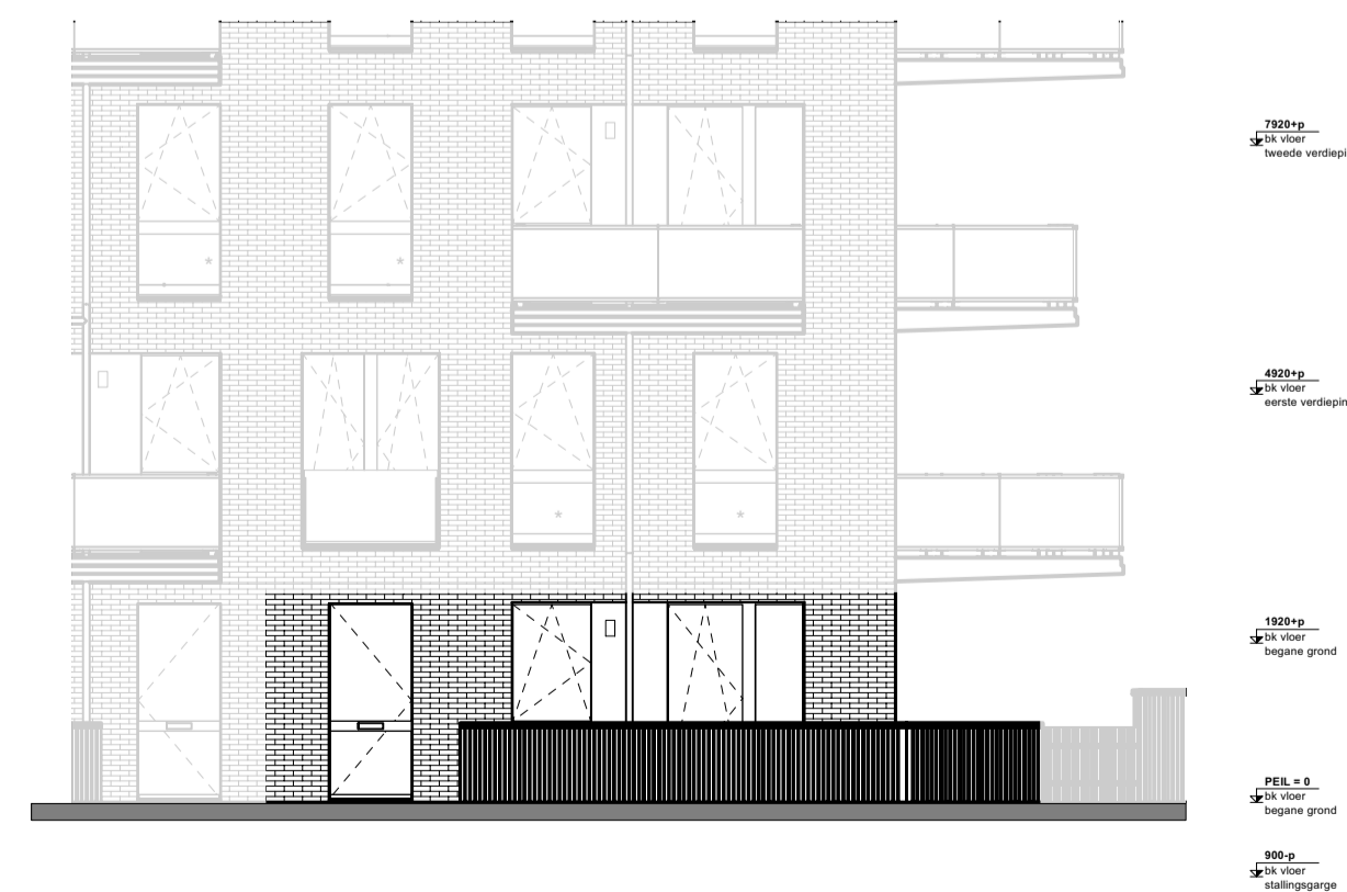
Westgevel begane grond 1:100