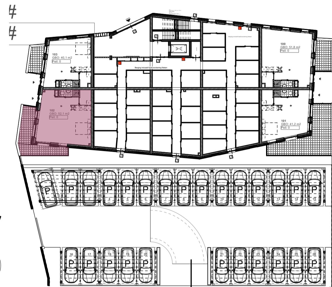
Overzicht begane grond Bouwnummer: 102 Woningtype: A.3