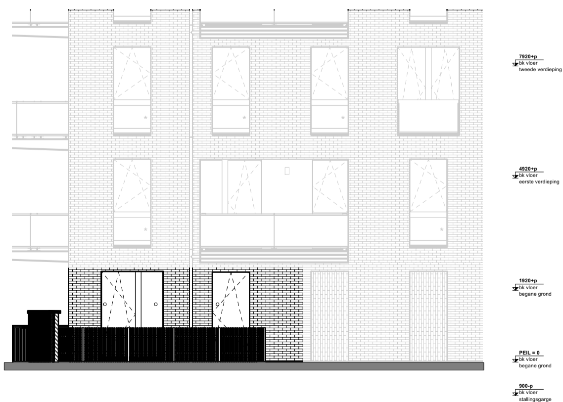
Zuidgevel begane grond 1:100