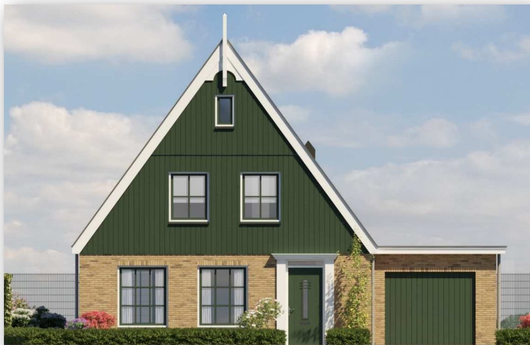
Bnr 11 is afgebeeld