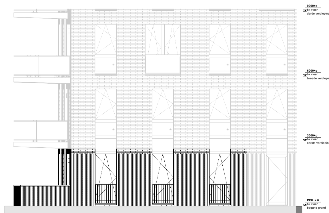
Noordgevel begane grond 1:100