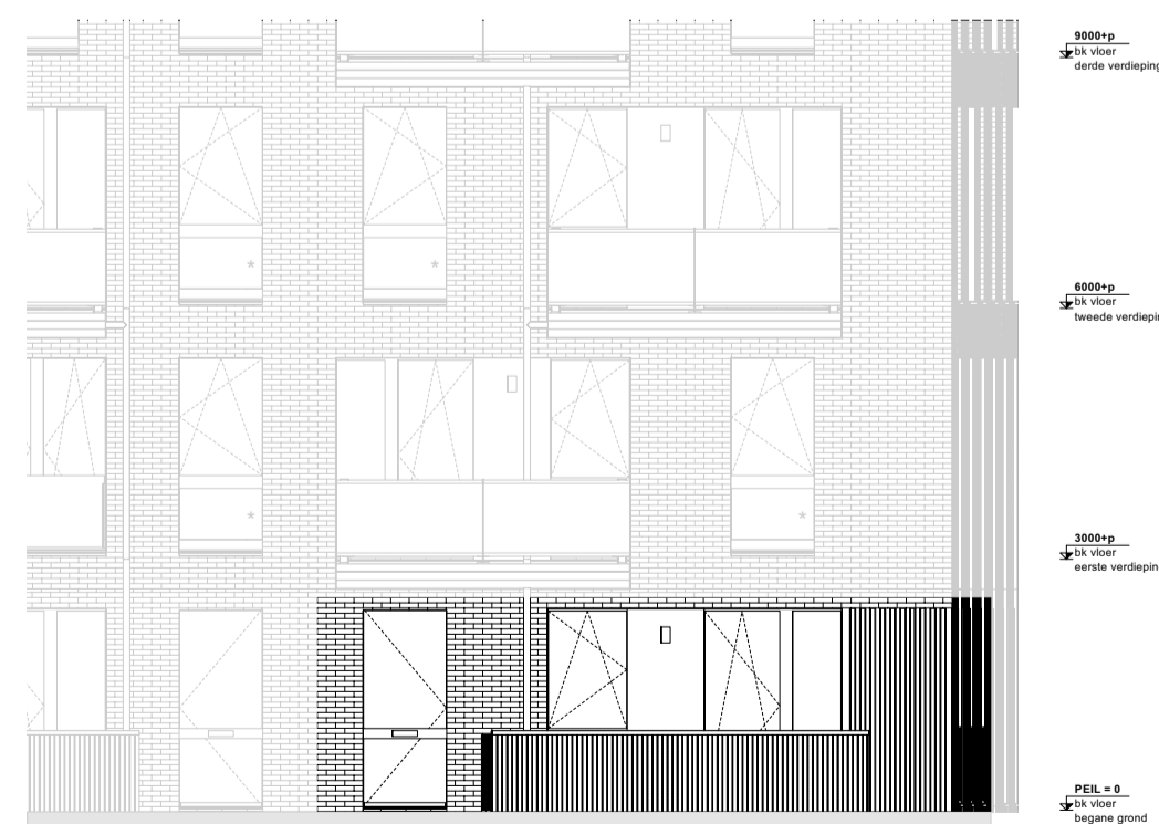
Oostgevel begane grond 1:100