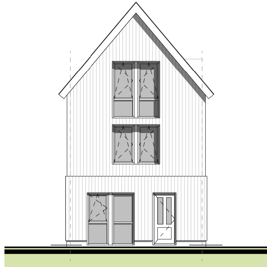
voorgevel 1.02 1 : 100