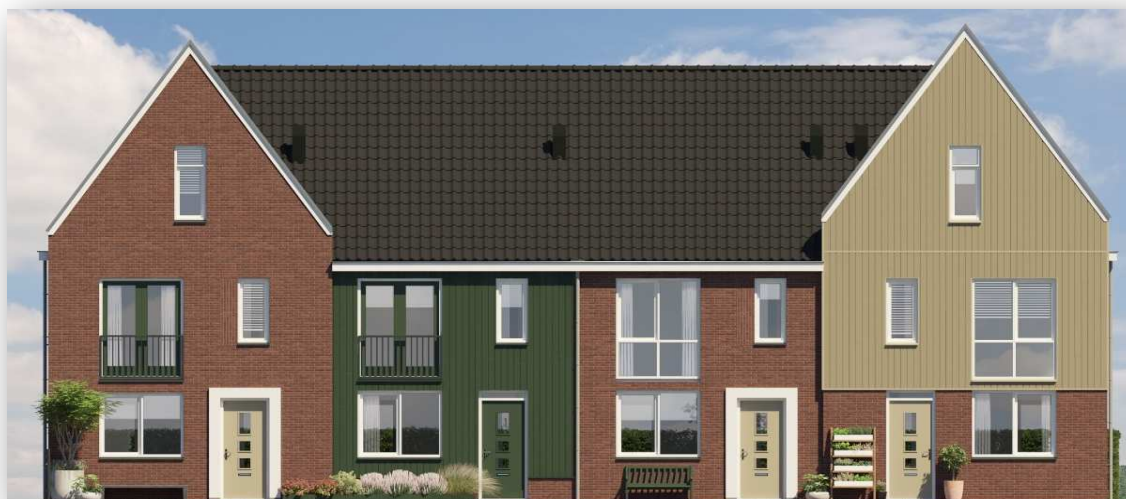
Bnr 15 t/m 18 zijn afgebeeld