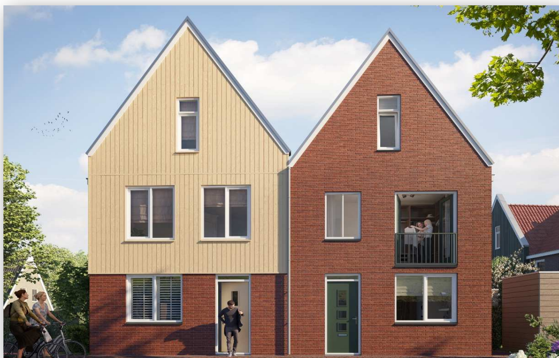
Bnr 24 en 25 zijn afgebeeld