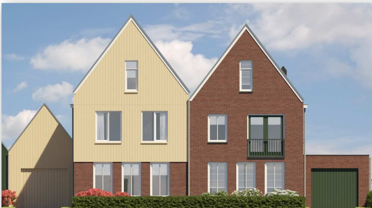
Bnr 2 en 3 zijn afgebeeld